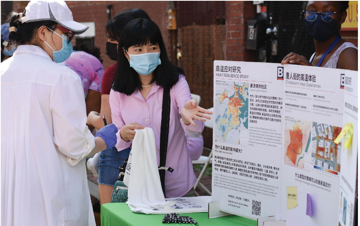
许多低收入社区的居民暴露在极端高温下，这是气候变化的有害影响，使他们在疫情期间特别容易生病。唐人街居民于2021年8月在华人前进会(Chinese Progressive Association)举办的街区聚会上学习了建立高温应对的策略。

亚裔美国人似乎也比其他人更容易接受政府在强制或鼓励保护措施方面的积极性。移民戴口罩的习惯以及人们在一些亚洲国家为保护自己免受常见病毒和环境污染物的侵害而采取的其他行动可能会影响戴口罩的开放程度。